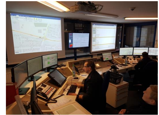
[Die FEZ im Unwetterbetrieb]

Zur Betriebsbereitschaft der FEZ gehören immer fünf ehren- und hauptamtliche Mitarbeiter*innen