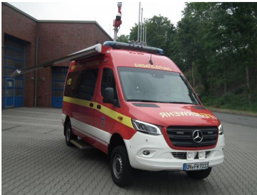
Der Einsatzleitwagen der Feuer- und Rettungswache